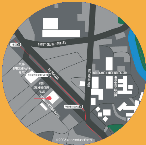
Anfahrtsroute zum Tagungsort